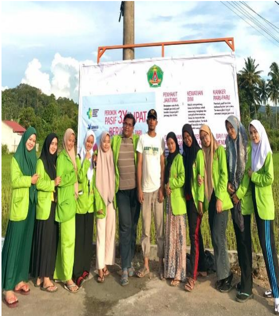
c) Gambar Kegiatan Pemasangan Poster Sampah dan tempat sampah Di Desa Purwodadi Dusun I